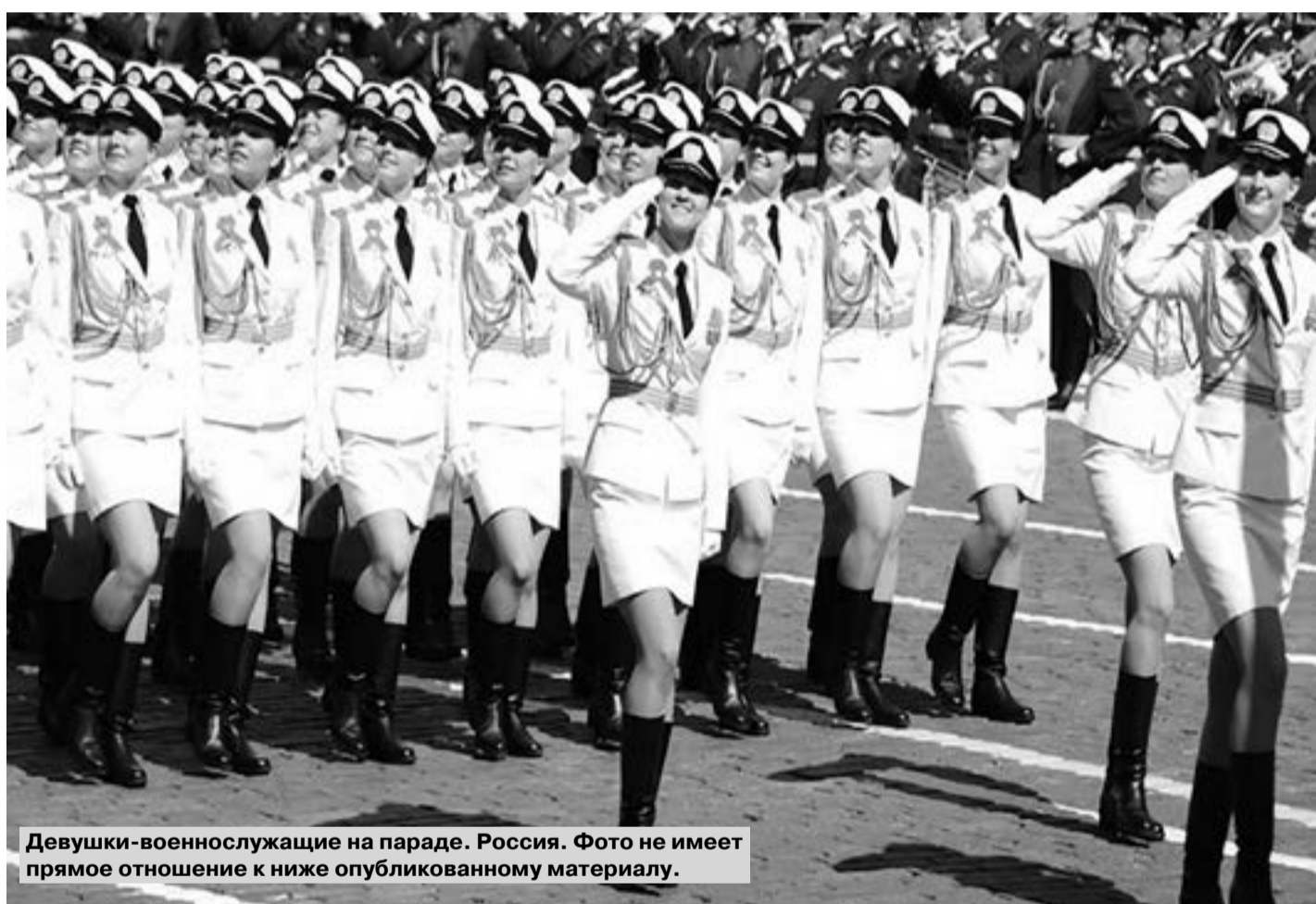
Девушки-военнослужащие на параде. Россия. Фото не имеет прямое отношение к ниже опубликованному материалу.

« В ворота гостиницы губернского города NN въехала довольно красивая рессорная небольшая бричка...»