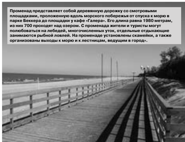
Променада представляет собой деревянную дорожку со смотровыми площадками, проложенную вдоль морского побережья от спуска к морю в парке Беккера до площадки у кафе «Галерея». Его длина равна 1980 метрам, из них 700 проходят над озером. С променада жители и туристы могут полюбоваться на лебедей, многочисленных уток, отдельные отдыхающие занимаются рыбной ловлей. На променаде установлены скамейки, а также организованы выходы к морю и к лестницам, ведущим в город».