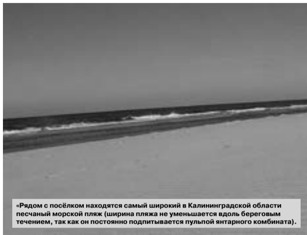
«Рядом с посёлком находится самый широкий в Калининградской области песчаный морской пляж (ширина пляжа не уменьшается вдоль береговым течением, так как он постоянно подпитывается пульпой янтарного комбината).