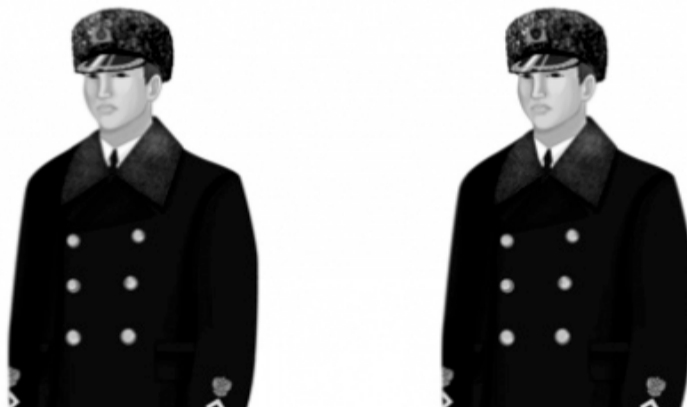
Рис. 1. Пальто зимнее мужское из ткани черного цвета с нарукавными знаками различия, меховое кепи с эмблемой для головного убора

будет несколько видов формы: выходная, повседневная и специальная (полевая). Каждый комплект будет иметь зимний и летний вариант. Выходит по шесть комплектов одежды на человека. В мужской форменный комплект входят 30 предметов, в том числе пальто, плащ, несколько костюмов (включая тропический) и рубашек, свитер, шинель, бушлат, а также головные уборы, обувь, ремень, перчатки и шарф. Женский же состоит только из 11 вещей, среди которых есть туфли, галстук-бант и шапка-кубанка.